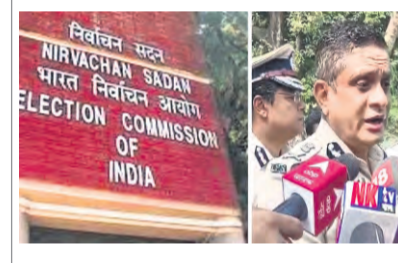
న్యూఢిల్లీ: దేశంలో సార్వత్రిక ఎన్నికలకు ముందు ఆయా రాష్ట్రాల ఉన్నతాధికారులపై ఎన్నికల సంఘం కొందా ఘోషించింది. గుజరాత్, ఉత్తరప్రదేశ్, బీహార్, జార్ఖండ్, హిమాచల్ ప్రదేశ్,

ప్రజాపక్షం/హైదరాబాద్ తమిళనాడు సౌందరరాజన్ రాష్ట్ర గవర్నర్ పదవిలో పాటు అదనపు బాధ్యతల్లో ఉన్న పుదుచ్చేరి లెఫ్టినెంట్ గవర్నర్ పదవికి సోమవారం రాజీనామా చేశారు. లోకసభ ఎన్నికల్లో తమిళనాడు నుంచి తమిళిసై పోటీ చేయనున్నారు. బిజెపి నుంచి పోటీ చేసేందుకు బిలుగా తమిళిసై రాజీనామా చేసినట్లు సమాచారం. ఈ మేరకు రాజీనామా లేఖను రాష్ట్రపతి ద్రౌపది మురళీకృష్ణ పంపారు. రాష్ట్ర పర్యటనకు వచ్చిన ప్రధానమంత్రి నరేంద్రమోడీతో సోమవారం ఉదయం తమిళిసై మర్యాదపూర్వకంగా సమావేశమయ్యారు. అనంతరం రాజీనామాపై నిర్ణయం తీసుకున్నట్లు తెలుస్తోంది. తమిళనాడుకు చెందిన తమిళిసై సౌందరరాజన్, 2019 సెప్టెంబర్ 8న తరువాతి 2లో