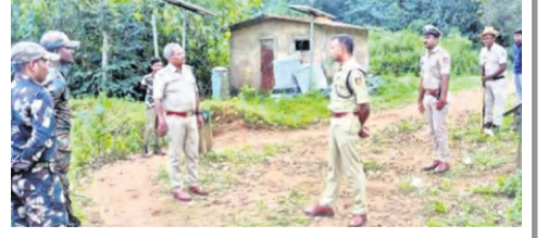
పలు మావోయిస్టు ప్రభావిత ప్రాంతాల్లో ఆయా రాష్ట్రాల పోలీసులు నిఘా కట్టుదిట్టం చేశారు. మావోయిస్టు ప్రభావిత ప్రాంతాల్లో ఉన్న ప్రధాన రాష్ట్రాల నాలుగైదు గొలుసుకట్టుగా ఉండటంతో అధికారులు గట్టి నిఘా పెడుతున్నారు. ఛత్తీస్ గఢ్ లో మావోయిస్టుల సమావేశం పాలన సాగుతున్న వేళ ఈ మధ్యకాలంలో కేంద్ర కోర్టులు గాలు మావోయిస్టు నేత హిద్రా జలాకాలో అత్యంత తరువాతి 2లో

మావోయిస్టు ప్రభావిత ప్రాంతాలపై గట్టి నిఘా త్వరలో అంతర్ రాష్ట్ర పోలీస్ అధికారుల సమావేశం ప్రజాపక్షం/భద్రాచలం లోకసభ, ఐదు రాష్ట్రాల అసెంబ్లీ ఎన్నికల వేళ మావోయిస్టు ప్రభావిత ప్రాంతాల్లో హై అలర్ట్ కొనసాగుతోంది. మూడు రోజుల తీవ్ర కేంద్ర ఎన్నికల సంఘం ఎన్నికల షెడ్యూల్ ప్రకటించడంతో దేశ వ్యాప్తంగా ఎన్నికల వాతావరణం నెలకొంది. ప్రధానంగా తెలంగాణ, ఆంధ్రప్రదేశ్, ఛత్తీస్ గఢ్, ఒడిశా, మహారాష్ట్రలలో పాటు తరువాతి 2లో