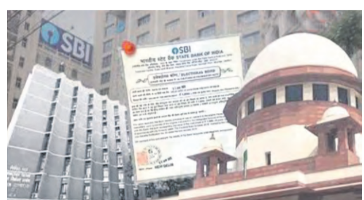
అనుభవం ఎన్నికల కమిషన్ (జిఎస్) తన వెబ్ సైట్లో అప్లోడ్ చేయాలని తెలిపింది. 2018లో కేంద్ర ప్రభుత్వం ప్రవేశపెట్టిన ఎలక్టోరల్ బాండ్ స్కీమ్ (ఇబిఎస్) రాజ్యాంగ విరుద్ధమని సుప్రీంకోర్టు స్పష్టం చేసిన విషయం తెలిసింది. ఈ బాండ్ల జారీని రద్దు చేస్తూ, 2019, ఏప్రిల్ 11

న్యూఢిల్లీ: ఎంపిక చేసిన అంశాలకే పరిమితం కాకుండా, ఎలక్టోరల్ బాండ్లకు సంబంధించిన సంపూర్ణ సమాచారాన్ని ఈనెల 21వ తేదీలోగా వెల్లడించాలని సుప్రీంకోర్టు ఆదేశించింది. (ఎన్ బిఐ)ను సుప్రీంకోర్టు సోమవారం ఆదేశించింది. ఈ బాండ్లను కొనుగోలుదారులు, గ్రాహక రాజకీయ పార్టీల మధ్య సంబంధాన్ని బహిష్కరించే సేవలను, విశిష్ట బాండ్ల సంబంధం కూడా ప్రకటించాలని భారత ప్రధాన న్యాయమూర్తి (సిజెబి) జస్టిన్ డివై చంద్రచౌదరి నేతృత్వంలో, జస్టిన్ సంతోష్ ఖన్నా, జస్టిన్ బిఆర్ గవాయ్, జస్టిన్ జెబి పార్గి వాలా, జస్టిన్ మనోజ్ మిశ్రాతో కూడిన సుప్రీంకోర్టు ధర్మాసనం పేర్కొంది. ఎన్ బిఐ తన ఆధీనంలో ఉన్న అన్ని వివరాలను, ఏ ఏదైనా ఎంపికలు లేకుండా వెల్లడించాల్సిన అవసరం ఉందని తెలిపింది. ఎన్ బిఐను సుంచి స్వీకరించిన వివరాలు