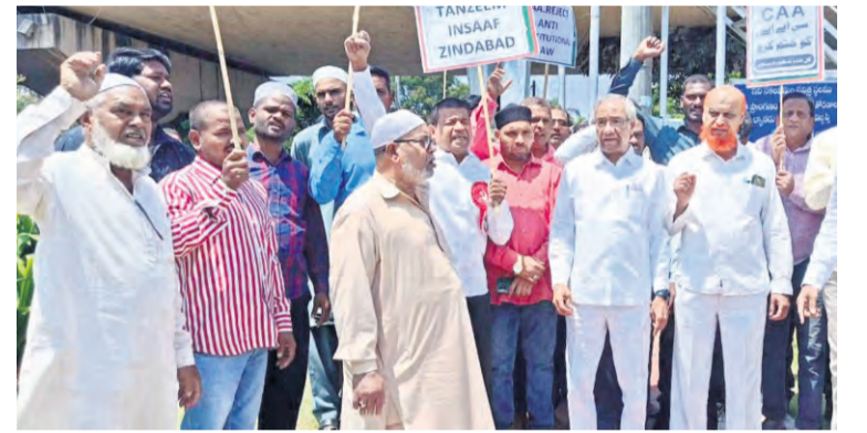
ప్రజాపక్షం / హైదరాబాద్

సిపిఐ జాతీయ కార్యదర్శి సయ్యద్ అజీజ్ హాజి హైదరాబాద్ లోని అంబేద్కర్ విగ్రహం వద్ద ఇన్సాఫ్ నిరసన