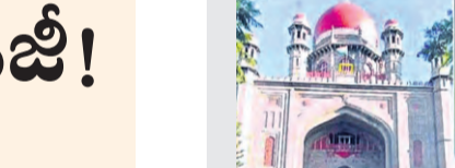
ప్రజాపక్షం / హైదరాబాద్ ఫోన్ ట్యాపింగ్ వ్యవహారంలో పోలీసు కస్టోడియన్ అప్పగిస్తూ కింది కోర్టు ఇచ్చిన ఆదేశాలను సవాలు చేస్తూ సైబరా్ ఇంటిలో