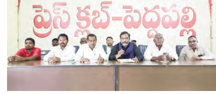
మాదిగలను విస్మరిస్తే తిరుగుబాటు చేస్తాం. దళిత ఐక్య వేదిక నాయకుల హెచ్చరిక