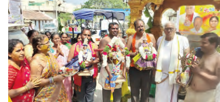
పెద్ద ఎత్తున పాల్గొన్న భక్తులు ముగిసిన బ్రహ్మోత్సవాలు