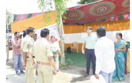
ఈ నెలాఖరులోపు వంద శాతం పన్ను వసూలు పూర్తి చేయాలి

ఈ నెలాఖరులోపు వంద శాతం పన్ను వసూలు పూర్తి చేయాలని జిల్లా కలెక్టర్ ఆశిష్ సంగ్వాన్ అధికారులను ఆదేశించారు.శుక్రవారం సాయంత్రం కలెక్టరేట్ సమావేశ మందిరంలో రెవెన్యూ,పంచాయతీ రాజ్ శాఖల అధికారులతో ఆయన సమీక్షా సమావేశం