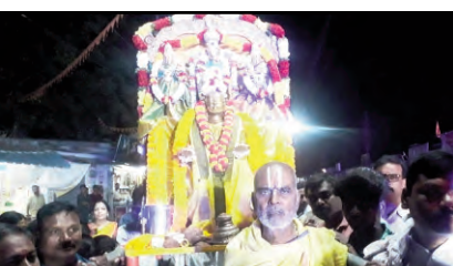
కమిటీ సభ్యులు, భక్తజనులు పాల్గొన్నారు.