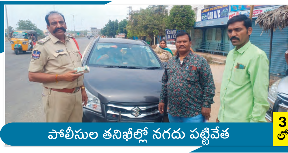
పోలీసుల తనిఖీల్లో నగదు పట్టివేత