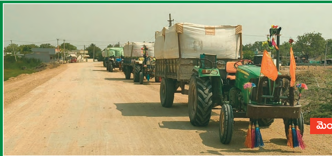
ధాన్యం కేంద్రాలు లేక రైతులకు ఇబ్బందులు