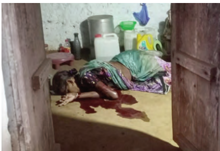
దాడి చేయగా ఆమె అక్కడికక్కడే మృతి చెందింది. పోలీసులు సంఘటన స్థలానికి చేరుకొని విచారణ చేపట్టారు.