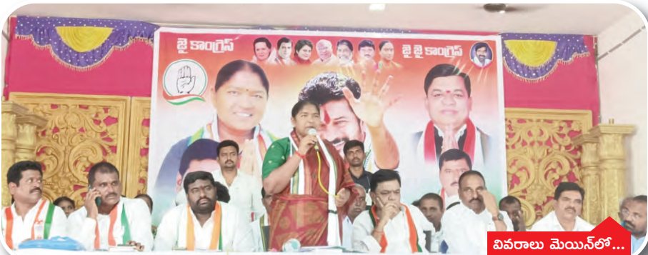
వివరాలు మెయిన్ లో...