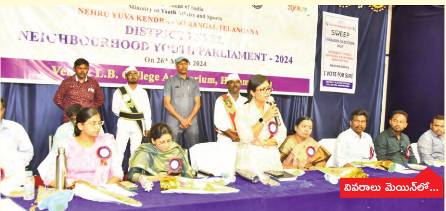
వివరాలు మెయిన్ లో...