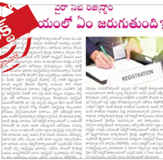
వైరా నడ రిజిస్ట్రార్ కార్యాలయంలో ఎలాంటి రిజిస్ట్రేషన్ల అయిన వారు కరుణ చూపిస్తే ఆ రిజిస్ట్రేషన్ల చేస్తారు. అది 1/70 యాక్ట్ అయినా నడ రిజిస్ట్రార్ కార్యాలయంలో తప్పకుండా రిజిస్ట్రేషన్లు చేసే పాత చట్టం.