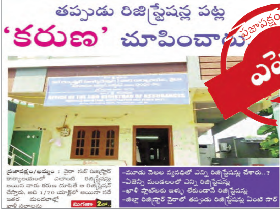
ప్రజాపక్షం/ఖమ్మం : వైరా నడ రిజిస్ట్రార్ కార్యాలయంలో ఎలాంటి రిజిస్ట్రేషన్ల అయిన వారు కరుణ చూపిస్తే ఆ రిజిస్ట్రేషన్ల చేస్తారు. అది 1/70 యాక్ట్ అయినా నడ రిజిస్ట్రార్ కార్యాలయంలో తప్పకుండా రిజిస్ట్రేషన్లు చేసే పాత చట్టం.