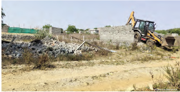
అయన తెలిపారు. ప్రభుత్వ నిబంధనల ప్రకారం అసైన్డ్ భూమిని ఏ ఉద్దేశం కోసం ప్రభుత్వం ఇచ్చిందో దాని ప్రకారం ఇండ్లు కట్టుకుని నివాసం ఉండాలి కానీ ఇతరులకు అమ్ముకోవడం వీలులేదన్నారు. సుమారు 25 సంవత్సరాలుగా అసైన్డ్ చేసిన స్థలాలు నిరుపయోగంగా ఉండడంతో అట్టి స్థలాలను ప్రభుత్వం తిరిగి స్వాధీనం చేసుకోవడానికి చర్యలు చేపట్టిందిన్నారు. ఇందులో భాగంగా

నిరుపయోగంగా ఉన్న స్థలాలు స్వాధీనం : తహసీల్దార్ స్వామి అసైన్డ్ చేసిన స్థలం నిరుపయోగంగా ఉండడంతో తిరిగి స్వాధీనం చేసుకుంటున్నట్లు ఖమ్మం అర్బన్ తహసీల్దార్ సిహెచ్ స్వామి తెలిపారు. 1997, 2005 సంవత్సరంలో వైఎస్ఆర్ కాలనీ సమీపంలో సర్వే నెం.37లో స్వాతంత్ర్య సమరయోధులకు ఒక్కొక్కరికి 144 చదరపు గజాల చొప్పున 439 మందికి ప్రభుత్వ స్థలాన్ని అసైన్డ్ చేసిందిన్నారు. అట్టి స్థలంలో అసైన్డ్ చేసిన వారు ఉండక పోవడం కొందరు అట్టి స్థలాలను మరొకరికి అమ్ముకోవడం జరిగినట్లు