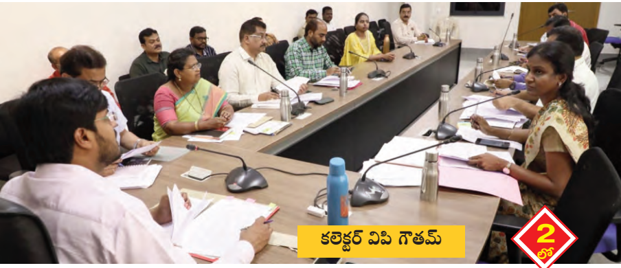
కలెక్టర్ విపి గౌతమ్ 2 తో