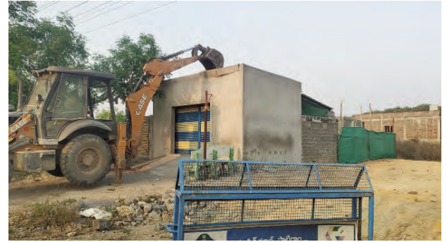
గురువారం అట్టి స్థలాల్లో ఉన్న 20 బేసెమెంట్లు, 20 షెడ్లను రెవెన్యూ, మున్సిపల్, పోలీసుల ఆధ్వర్యంలో తొలగించి ప్రభుత్వ ఆధీనంలోకి తీసుకోవడం జరిగిందిన్నారు. ఇట్టి స్థలాలపై అభ్యంతరాలు ఉన్న వారు తమ వద్ద ఉన్న ఒరిజినల్ పట్టాలతో ఖమ్మం అర్బన్ మండల తహసీల్దార్ ను సంప్రదించాలని ఆయన తెలిపారు.