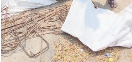
స్తున్న వీరు మరోమారు ఇనుప రాడ్లను తరలిస్తుండగా మరోసారి దొరకగా గ్రామస్థులు ఇంకొకసారి మళ్ళీ ఓడేడు గ్రామానికి వచ్చి మానేరు బ్రిడ్జి వద్దనున్న రాడ్లను దొంగలిస్తే పట్టుకొని పోలీసులకు సమాచారం ఇస్తామని గ్రామస్థులు హెచ్చరించి వదిలేశారు.

ప్రజాపక్షం/ముత్తూరం : పెద్దపల్లి జిల్లా ముత్తూరం మండలంలోని ఓడేడు మానేరు వాగుపై నిర్మించనున్న బ్రిడ్జి సంబంధించిన ఇనుప రాడ్లను మంథని మున్సిపల్ కి చెందిన ముగ్గురు మహిళలు ఇనుప సామాన్ (రాడ్లు) అక్రమంగా దొంగలించి ఎత్తుకెళ్తున్న వారిని ఓడేడు గ్రామస్థులు బస్టాండ్ ఆవరణలో ముగ్గురు మహిళలను పట్టుకున్నారు. పట్టుకున్న మహిళల వద్ద నుండి సుమారు 50 నుండి 80 కిలోల వరకు ఉన్న ఇనుప రాడ్లను పట్టుకొని తిరిగి మానేరు ఒడ్డున ఉన్న బ్రిడ్జి వద్ద మహిళలచే ఏదా సాధనలో రాడ్లను వేసివారు. ఇదే ముగ్గురు మహిళలు చాలాసార్లు ఇనుప రాడ్లను అక్రమంగా సుమారు 5 సార్లు దొంగలించి మంథనికి తరలి