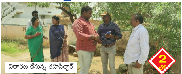
విచారణ చేస్తున్న తహసీల్దార్