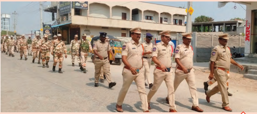
శాంతి భద్రతల పరిరక్షణకే కేంద్ర బలగాలతో కవాతు