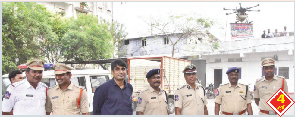
ఆపరేషన్ గరుడ ప్రారంభం