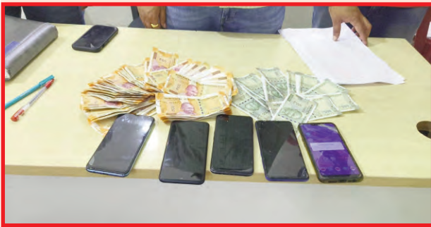
ఆన్లైన్ ద్వారా ఆర్థిక లావాదేవీలు అప్పుల ఊబిలో కూరుకుపోతున్న బాధితులు

ప్రజాపక్షం/పంచికల్ పేట్ : ఐపిఎల్ క్రికెట్ బెట్టింగ్ లు కొమరం భీమ్ ఆసిఫా బాద్ జిల్లాలో జోరుగా సాగుతున్నాయి. బంటికి బంటికి, పాట్ పాట్ కి బెట్టింగ్ చావా సాగుతోంది. వికెట్ పడితే ఇంత, ఎలోబి అయితే ఇంత, ఫోర్ కొట్టిన, బంటిని నేరుగా గ్రౌండ్ అవతలికి పంపిన డబ్బులే డబ్బులు.. ఈ బెట్టింగ్ పుణ్యమా అని వ్యాపారులతో పాటు యువత, ఉద్యోగిస్తులు అప్పులపాలు అవుతున్నారు. జిల్లాలో జోరుగా బెట్టింగులు సాగుతున్నట్లు తెలుస్తుంది. జిల్లాలోని పెంచికల్ పేట్, కాగజ్ నగర్, దహగాం, బెజ్జూర్, కౌటాల, చింతలమానేపల్లి, సిర్పూర్ మండలాలతో పాటు తదితర ప్రాంతాలలో బెట్టింగ్ లకు పాల్పడుతున్నారని సమాచారం. మండలాలతో పాటు పట్టణ, పల్లె ప్రాంతాలలో పలువురు ఉద్యోగులు, వ్యాపారులు, యువకులు బెట్టింగ్ పేరిట భారీ మొత్తంలో నష్టపోయినట్లు తెలుస్తుంది. క్రికెట్ అంటే నేటి యువతకు ఎంతో మక్కువ ఉంటుంది. సమయం దొరికితే చాలు బ్యాట్ బాల్ పట్టుకొని మైదానాల వెంట పరుగులు తీస్తుంటారు. ఇక దేశవాళి క్రికెట్ పోటీలు జరిగే రోజులు వారికి సందడి