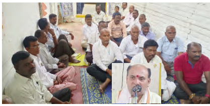
గంలో సంవత్సరం క్రోధినామ సంవత్సరం అంటే క్రోధంను కలిగించేది అర్థమవుతుంది. ఈ పంచాంగంలో ప్రజలు కొద్దిపాటి అవేశంతో, కోపంతో వ్యవహరిస్తారని పండితులు అన్నారు. కుటుంభ సభ్యుల మధ్య

ప్రజాపక్షం/ఎల్లారెడ్డిపేట : ఈ ఏడు ప్రజలు కోసతా పాలకు వెళ్లకుండా సుభిక్షంగా ఉండాలని ఉగాది పండుగను జరుపుకుంటున్నామని ఎల్లారెడ్డిపేట మండల మార్కెట్లు, శ్రీవేణుగోపాలస్వామి పలు ఆలయాలలో అర్చకులు పంచాంగ శ్రవణం నిర్వహించారు. ఆలయాలలో మండల వర్తక వ్యాపారులు మండల ప్రజలు విన్నారు. వెంకటాపూర్ గ్రామంలో ఓమోజయ ఆశ్రమంలో పంచాంగ శ్రవణం వినిపించారు. సుదర్శన చండియాగం వేదపండితులు నడుమ కొనసాగించారు. తెలుగు ప్రజానిక క్రోధినామ సంవత్సరంలో అడుగుపెట్టనున్నారని పేర్కొన్నారు.కలియ