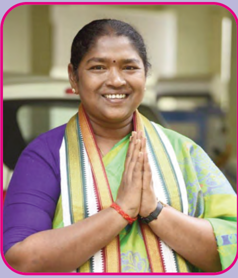
మనిషిలోని చెడు భావనలను, అధర్మాన్ని, ద్వేషాన్ని రూపుమాపే గొప్ప పండగ రంజాన్ అని సీతక్క అన్నారు.

ప్రజాపక్షం/ములుగు జిల్లా ప్రతినిధి : రంజాన్ పండగ మత సామరస్యానికి, సహృద్ధాత్వానికి, సర్వ మానవ సమానత్వానికి, కరుణకు, దాతృత్వానికి ప్రతీక అని తెలంగాణ రాష్ట్ర మంత్రి సీతక్క పేర్కొన్నారు. అల్లా దీవెనలతో రాష్ట్ర ప్రజలకు, ప్రపంచ మానవాళికి సకల శుభాలు కలగాలని ఆయన ఆకాంక్షించారు. క్రమశిక్షణ, దాతృత్వం, ధార్మిక చింతనల కలయికే రంజాన్ మాసం విశిష్టత అని, దివ్య ఖురాన్ అవతరించిన ఈ మాసంలో కఠిన ఉపవాస దీక్షలకు రంజాన్ ముగింపు వేడుక అని రాష్ట్ర పంచాయతీరాజ్ గ్రామీణాభివృద్ధి, స్త్రీ, శిశు సంక్షేమశాఖ మంత్రి సీతక్క పేర్కొన్నారు. క్రమశిక్షణతో ఉండడం, ఐకమత్యంతో మెలగడం, పేదలకు తోడ్పడడం ఈ పండగ మాసవాళికి ఇచ్చే సందేశమని,