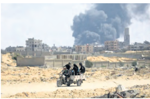
సారి స్పష్టం చేశారు. పశ్చిమాసియాలో పరిస్థితులు చైనా, టర్కీ, సౌదీఅరేబియా విదేశాంగమంత్రులతో అమెరికా విదేశాంగమంత్రి అంటోనీ బ్లినకెన్ చర్చలు జరుపుతున్నారు. ఇంకొకవైపు ఇజ్రాయిల్ డిఫెన్స్ ఫోర్స్ జనరల్ కూడా అత్యవసరంగా సమావేశం జరిపి పూర్వ రచనలు చేస్తున్నారు. ఇరాన్ దాడి చేసే చూస్తూ ఉరుకోబోమని, ప్రతిదాడులు చేస్తుమని ఇజ్రాయిల్ రక్షణమంత్రి

బెజ్జా : ఇజ్రాయిల్ ను శిక్షించడం భావించిన, ఐతే తొందర పాటు నిర్ణయం మాత్రం తీసుకోబోమని ఇరాన్ శుక్రవారంనాడు స్పష్టం చేసింది. సిరియా దమాస్కస్ లో ఇరాన్ దౌత్యకార్యాలయంపై ఇజ్రాయిల్ దాడి చేసిన తర్వాత ఇరాన్ సర్కాడైన ఈ యుద్ధాభ్యాసాలను చేసిన హెచ్చరికతో పశ్చిమాసియాలో తీవ్ర ఉద్రిక్త వాతావరణం ఏర్పడింది. ఏ క్షణంలోనైనా ఇరాన్ దాడులు చేస్తుందన్న వార్తలతో ఇజ్రాయిల్ కూడా సన్నద్ధమైంది. తాము అప్రమత్తంగా ఉన్నామని, ఐతే పై ఎల్ల ప్రశ్నలేదీని ఇజ్రాయిల్ పేర్కొంది. ఐక్య రాజ్యసమితి రంగంలోకి దిగి ఇజ్రాయిల్ ను అదుపుచేసే తమకు అభ్యంతరం లేదని కూడా ఇరాన్ ప్రకటించింది. ఇజ్రాయిల్ పై దాడి చేస్తున్న, ఐతే అత్యంత బీభత్సంగా, ప్రపంచానికి పెను సమస్యలు సృష్టించేటట్లుగా ఈ దాడులు ఉండవలసి కూడా స్పష్టం చేసింది. మరోవైపు అమెరికా అధ్యక్షుడు జో బైడెన్ గురువారం నాడు ఇరాన్ ప్రధానమంత్రి కిద్మాత్ సమావేశం సందర్భంగా, ఇరాన్ దౌత్యకార్యాలయంపై దాడిలో తమ ప్రయోగం లేదని మరో