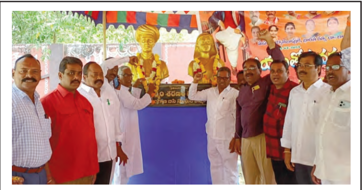
జ్యోతిరావు పూలే జయంతి సందర్భంగా నివాళులర్పిస్తున్న చిసి హక్కుల సాధన సమితి నాయకులు