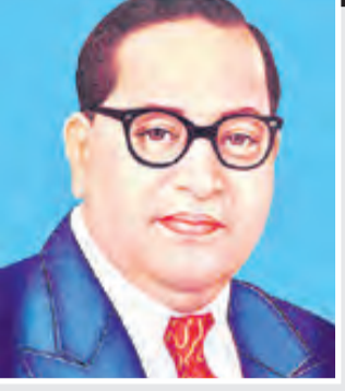
నేడు అంబేద్కర్ జయంతి జయంతి: 14 ఏప్రిల్, 1891 వర్ధంతి: 6 డిసెంబర్, 1956