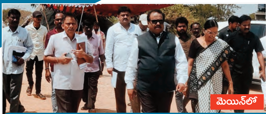
ధాన్యం కొనుగోలులో అలసత్వం వహించరాదు