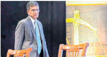
జస్టిస్ డీవకే వర్మ, జస్టిస్ కృష్ణ మురారి, జస్టిస్ డివై చంద్రచూడ్కు, జస్టిస్ ఎంఆర్ షా కూడా భారత ప్రధాన న్యాయమూర్తికి లేఖ రాసిన భృందంలో ఉన్నారు. కొంత మంది ప్రతిపక్ష నాయకులపై అవినీతి ఆరోపణలు రావడం, ఎన్ఫోర్స్ మెంట్ డైరెక్టరేట్ (ఇడి), సిబిఐ వంటి ప్రభుత్వ సంస్థలు వారిపై

న్యూఢిల్లీ: దేశంలో న్యాయవ్యవస్థను అణగదొక్కే ప్రయత్నం చేస్తున్నారని ఆందోళన వ్యక్తం చేస్తూ, సుప్రీం కోర్టు ప్రధాన న్యాయమూర్తి డివై చంద్రచూడ్కు 21 మంది మాజీ న్యాయమూర్తుల భృందం ఒక లేఖ రాసింది. తప్పుడు సమాచారం, బహిరంగంగా అవమానించడం వంటి చర్యల ద్వారా న్యాయవ్యవస్థపై ఒత్తిడి పెంచేందుకు ప్రయత్నాలు జరుగుతున్నాయని ఈ మాజీ న్యాయమూర్తులు తమ లేఖలో పేర్కొన్నారు. సంకచిత రాజకీయ లేదా వ్యక్తిగత ప్రయోజనాల కోసం ఈ విమర్శకులు న్యాయవ్యవస్థపై ప్రజల నమ్మకాన్ని పట్టు చేయడానికి కుట్ర చేస్తున్నట్లు ఆరోపించారు. సుప్రీం కోర్టు మాజీ న్యాయమూర్తులు