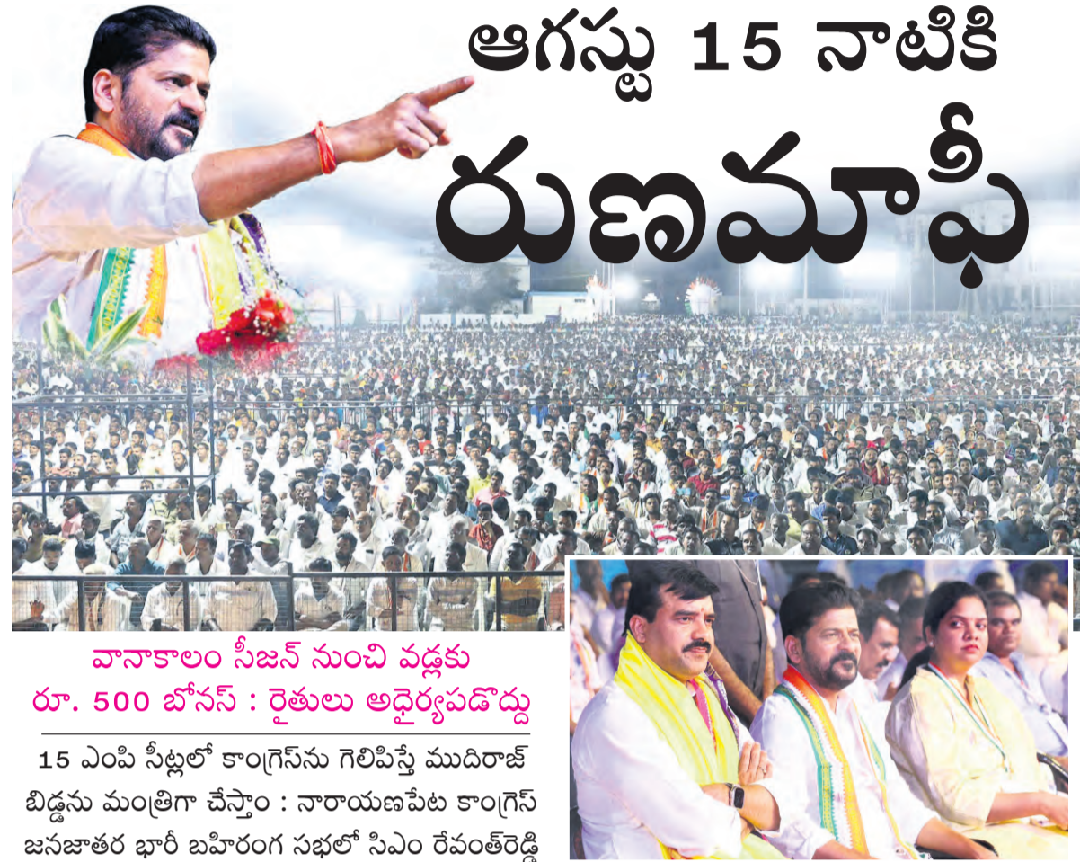
వానకాలం సీజన్ నుంచి వడ్డకు రూ. 500 బోనస్ : రైతులు అద్దెర్యపడెద్దు 15 ఎంపి సీట్లలో కాంగ్రెస్ను గెలిపిస్తే ముదిరాజ్ బిడ్డను మంత్రిగా చేస్తాం : నారాయణపేట కాంగ్రెస్ జనజాతర భారీ బహిరంగ సభలో సిఎం రేవంత్ రెడ్డి

ముదిరాజ్ బిడ్డను మంత్రిగా చేస్తానని మాటిచాడు. మాదిగల వర్గీకరణ జరగాల్సిందేనని, వారికి న్యాయం జరగాల్సిందేనని, భవిష్యత్లో మాదిగలకు మరిన్ని పదవులు ఇచ్చి సముచిత స్థానం కల్పించామని హామీ ఇచ్చారు. ఢిల్లీ మధ్యం కేసులో బిడ్డను కేంద్రంలోని బిజెపి ప్రభుత్వం జైలులో పెట్టగానే కవితకు బెయిల్ కోసం మోడీ క్యాబ్ వద్ద తెలంగాణను తెనిగిస్తామని అక్కడ వచ్చి రాష్ట్రంలో కాంగ్రెస్ను ఓడించడానికి మోడీ వద్ద తెనిగిస్తామని హామీ ఇచ్చారు. నారాయణపేటలో సోమవారం జరిగిన కాంగ్రెస్ జనజాతర భారీ బహిరంగ సభలో ముఖ్యమంత్రి రేవంత్ రెడ్డి మాట్లాడారు. బహిరంగ