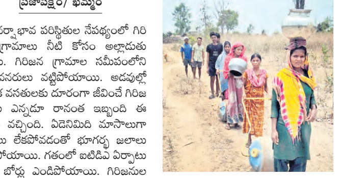
సంస్థల (బిడిపి) ద్వారా ఖర్చు చేసిన గణాంకాలను చూస్తే ఆశ్చర్యం అనిపిస్తుంది. గిరిజన గ్రామాల్లో మౌలిక వసతుల కోసం కోట్లాది

తీవ్ర వర్షాభావ పరిస్థితులు నేపథ్యంలో గిరిజన గ్రామాలు నీటి కోసం అల్లాడుతున్నాయి. గిరిజన గ్రామాల సమీపంలోని జల వనరులు వణిగిపోయాయి. అడవుల్లో మౌలిక వసతులకు దూరంగా జీవించే గిరిజన వసులకు ఎన్నడూ రాసంక ఇబ్బంది ఈ ఏడాది వచ్చింది. ఏడెనిమిది మాసాలూ వర్షాలు లేకపోవడంలో భూగర్భ జలాలు ఇంకపోయాయి. గతంలో బిడిపి ఏర్పాటు చేసిన బోధ్ల ఎండిపోయాయి. గిరిజనుల పేరిట కేంద్ర, రాష్ట్ర ప్రభుత్వాలు బడ్జెట్లో యోలా కోట్లాది రూపాయలు కేటాయిస్తున్నా ఏ వెళ్తుకు వెళ్తున్నా కానీ గిరిజనుల దరి చేరడం లేదు. సమీకృత గిరిజనాభివృద్ధి