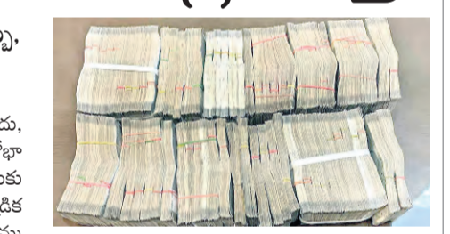
దానికంటే ఇది ఎక్కువ కావడం గమనార్హం. గత ఎన్నికల సమయంలో మొత్తం రూ. 3,475 కోట్లు స్వాధీనం చేసుకోగా, ఈసారి భారీ ఇప్పటి వరకే భారీ స్వాధీనం అక్రమ నగదు, ఇతర కాయాలూ పట్టుబడినట్లు ఇది పేర్కొంది. దేశంలో

న్యూఢిల్లీ: సాంకేతిక ఎన్నికల వేళ దేశంలో నగదు, మద్యం ఏరులెవారుతోంది. అయితే ఓట్లపై ప్రలోభాలకు గురిచేసే ప్రయత్నాలకు అడ్డుకట్ట వేసేందుకు కేంద్ర ఎన్నికల సంఘం చర్యలు చేపట్టింది. ఎక్కడికక్కడ పట్టిస్తే నిఘా ఏర్పాటు చేయడంలో పాటు ముమ్మరుగా తనిఖీలు నిర్వహిస్తోంది. దేశ వ్యాప్తంగా కొనసాగుతున్న తనిఖీల్లో ఇప్పటి వరకు రూ. 2,069 కోట్లు విలువైన మద్యం ద్రవ్యాలు సహా రూ. 4,650 కోట్లు మేరకు సీజ్ చేసినట్లు ఎన్నికల సంఘం వెల్లడించింది. 2019 సాంకేతిక ఎన్నికల సమయంలో జప్తు చేసిన