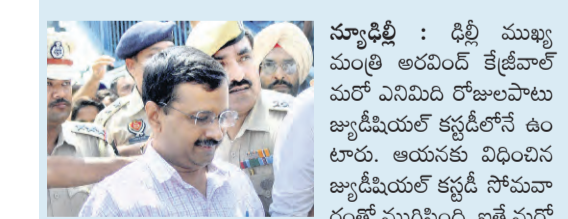
న్యూఢిల్లీ : ఢిల్లీ ముఖ్యమంత్రి అరవింద్ కేజ్రీవాల మరో ఎనిమిది రోజులపాటు జ్యూడిషియల్ కస్టడీలోనే ఉంటారు. అయినక విధించిన జ్యూడిషియల్ కస్టడీ సోమవారంతో ముగిసింది. ఐటీ కోర్టు