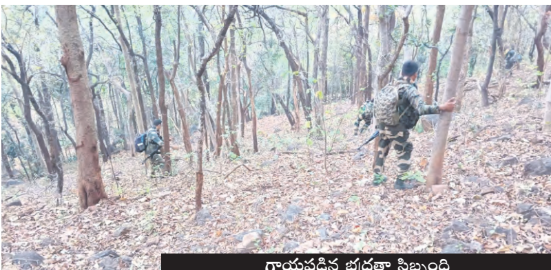
గాయపడిన భద్రతా సిబ్బంది

ఫత్తీన్ గాంకేర్ జిల్లాలో ఎదురుకాల్పులు ముగ్గురు భద్రతా సిబ్బందికి గాయాలు