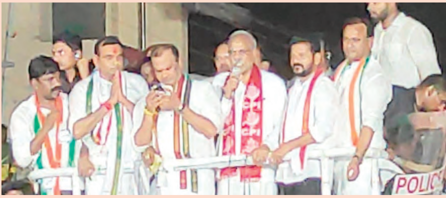
కమ్యూనిస్టుల్లారా.. కలసి రండి : సిఎం రేవంత్ (మెయిన్లో)