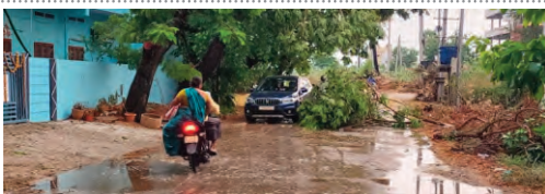
సూర్యాపేటలో వర్షం (మెయిన్లో)