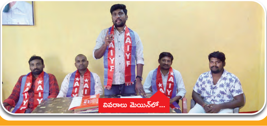
వివరాలు మెయిన్ లో...