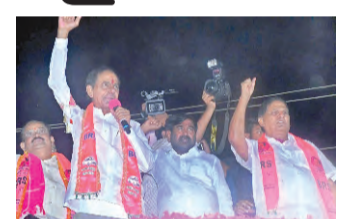
ప్రజాపక్షం / మిర్యాలగూడ

12 మంది ఎంపిలను గెలిపిస్తే భూమి, ఆకాశం ఒకటి చేసేంత పోరాటం రోడ్ డోలో మాజీ సిఎం కెసిఆర్ మెదలు వంచాలంటే బిఆర్ఎస్కు బలమివ్వాలని, ఆ పార్టీ అధినేత, మాజీ సిఎం కెసిఆర్ అన్నారు. బుద్ధవారం రాత్రి నల్లగొండ జిల్లా మిర్యాలగూడ పట్టణంలో రోడ్ డో ప్రారంభించి స్థానిక రాజీవ్ చౌక్ వద్ద జరిగిన సభలో ఆయన మాట్లాడారు. తనను జైలుకు తరువాయి 7లో