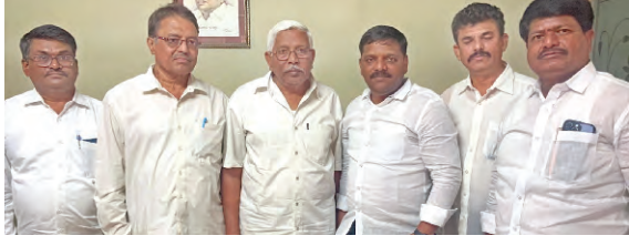
నల్లగొండ, వరంగల్, ఖమ్మం పట్టణంల ఎంపీలతో కలిసి కాంగ్రెస్ అభ్యర్థి తీర్థాచారి ప్రధాని మోదీ చేసిన వ్యాఖ్యలపైనే కేంద్ర ఎన్నికల సంఘం పట్టించుకోవడం లేదని టిపిసీసీ సీనియర్ ఉపాధ్యక్షుడు నిరంజన్ ఆరోపించారు. మోదీ వ్యాఖ్యలకు మోదీకి నోటీసులు ఇవ్వకుండా మోదీ అధ్యక్షుడికి ఇన్ నోటీసులు జారీ చేసినదని, మోదీని రక్షించేందుకు ఇన్ ప్రయత్నిస్తోందని, హైదరాబాద్ లోని గాంధీభవన్ లో శుక్రవారం ఏర్పాటు చేసిన మీడియా సమావేశంలో ఆయన మాట్లాడుతూ విధులు సక్రమంగా నిర్వహించలేదని అధికారులపై చర్యలు తీసుకుంటున్నానని, మోదీపై ఎందుకు చర్యలు తీసుకోవడం లేదని ప్రశ్నించారు.