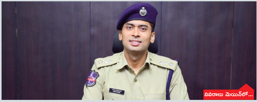
వివరాలు మెయిన్ లో...