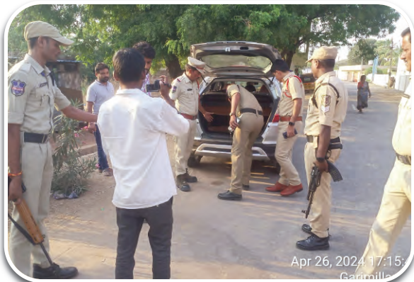
Apr 26, 2024 17:15 Gardmill