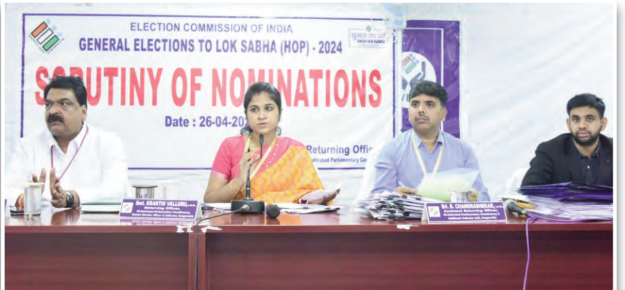
18 నామినేషన్లు తిరస్కరణ

ప్రజాపక్షం/ సంగారెడ్డి ప్రతినిధి: జహీరాబాద్ లోక సభ స్థానానికి అభ్యర్థుల నామినేషన్లలో 14 మంది అభ్యర్థులు 18 నామినేషన్లు తిరస్కరించినట్లు రిటర్నింగ్ అధికారి, జిల్లా కలెక్టర్ క్రాంతి చల్లూరు తెలిపారు. ఈ నెల 18 నుండి 25 వరకు స్వీకరించిన నామినేషన్ల ప్రక్రియలో భాగంగా 40 మంది అభ్యర్థులు 68 సెట్లు, వివిధ పార్టీల