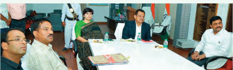
శాంతియుతంగా ఎన్నికలు జరిగేందుకు సహకరించాలి