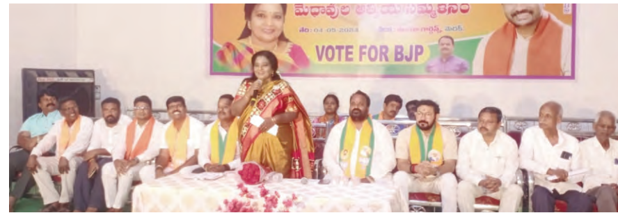
దేశ అభివృద్ధి మోదీ, మెదక్ అభివృద్ధి రఘునందన్ సాధ్యం తెలంగాణ మాజీ గవర్నర్ తమిళసై సొందర్య రాజన్