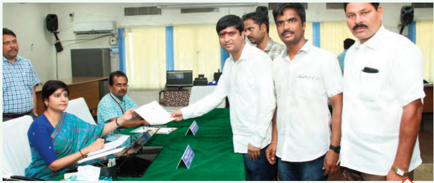
ఊపందుకున్న ఎంఎల్సీ నామినేషన్లు