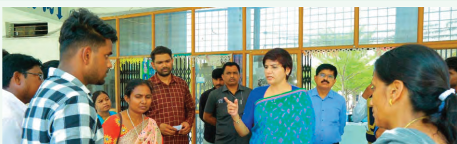
పోస్టల్ బ్యాలెట్ ఓటర్లకు ఇబ్బందులు కలుగవద్దు