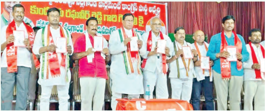
కార్మిక వ్యతిరేక మోదీ విధానాలకు చరమగీతం