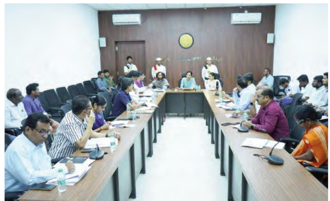
వరంగల్ రిటర్నింగ్ అధికారి, కలెక్టర్ ప్రావిణ్య

సీలింగ్ ఎలక్ట్రానిక్ ఓటింగ్ యంత్రాల సీలింగ్ తదితర అంశాలపై ఎన్నికల సిబ్బందికి రెండు రోజులు శిక్షణ ఇవ్వనున్నట్లు కలెక్టర్ తెలిపారు. శిక్షణను ఎన్నికల సిబ్బంది సద్వినియోగం చేసుకోవాలన్నారు. శిక్షణా సమయంలో ఏవైనా సందేహాలు వస్తే మాస్టర్ ట్రైనర్లు, ట్రైనర్లను అడిగి తమ సందేహాలను నివృత్తి చేసుకోవాలి అన్నారు. 13వ జరిగే పార్లమెంట్ ఎన్నికలు ప్రశాంత వాతావరణంలో సజావుగా జరిగేలా సిబ్బంది పని చేయాలన్నారు. ఎన్నికల నిర్వహణలో ఏవైనా సమస్యలు తలెత్తితే వెంటనే పై అధికారులకు సమాచారం అందించాలన్నారు. శిక్షణ కార్యక్రమానికి ఎన్నికల విధులకు నియమించిన అదనపు పోలింగ్ సిబ్బంది తప్పకుండా హాజరు కావాలని ఆదేశించారు.