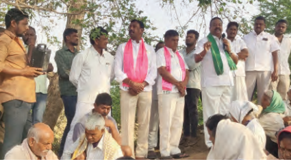
కంగా మారనున్నాయనే సందేహాలు స్థానికుల్లో వ్యక్తం అవుతున్నాయి. కాగా ప్రచారమంతా ఉపాధి కూలీల చుట్టే తిరుగుతుండడంతో గ్రామాల్లో ఎన్నికల హడావిడి కనిపించడం లేదు.

ప్రజాపక్షం/మల్లాపూర్ : గత కొన్నిరోజులుగా కొనసాగుతున్న పార్లమెంట్ ఎన్నికల ప్రచారంలో మూడు పార్టీల నేతలు ప్రత్యేకంగా ఉపాధి హామీ కూలీలను ప్రసన్నం చేసుకోవడంలో బిజె అయిపోయారు. గతంలో ఎన్నికల ప్రచారంలో ప్రతి గ్రామంలో నాయకులు బహిరంగ సభలు ఏర్పాటు చేసుకుని విస్తృతంగా ప్రచారం చేసేవారు. కానీ ప్రస్తుత పార్లమెంట్ ఎన్నికల్లో మాత్రం ప్రతి గ్రామంలో జరుగుతున్న ఉపాధి హామీ పనుల వద్దకు వెళ్లి కూలీలను ప్రసన్నం చేసుకుని ఓట్లను అభ్యర్థించడం ఈ పార్లమెంట్ ఎన్నికల్లో నయా ట్రెండ్‌గా మారింది. ఇలా ప్రతి పార్టీల నాయకులు ప్రత్యేకంగా ఉపాధి హామీ కూలీలను కలిసి ఓట్లను కోరుతుండడంతో కూలీల ఓట్లే కీలకమా?