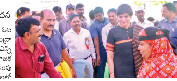
టున్నామని తెలిపారు. సి విజిల్ డ్వారా ఇప్పటివరకు 180 ఫిర్యాదులు రాగా, వాటన్నిటిని కేసులు 55 నిమిషాల లోపే విధులు అ ప్రదేశాలకు వెళ్లి పరిష్కరించడం జరిగిందని తెలిపారు.