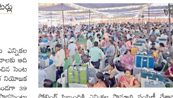
పోలింగ్ సిబ్బందికి ఎన్నికల సామాగ్రి పంపిణీ చేశారు. 13మే సమన్వయకర్తల పోలింగ్ కేంద్రాల్లో వెబ్ క్యాన్సిల్ సీన్ కెమెరాలను పోలింగ్ కేంద్రాల్లో అధికారులు సమన్వయకర్తలతో కలిసి పోలింగ్ కేంద్రాలకు తరలి వెళ్లారు.

మొత్తం 18,08,585 మంది ఓటర్లు 39 మంది అభ్యర్థులు 2141 పోలింగ్ కేంద్రాలు ప్రజాపక్షం/అలీరు : భువనగిరి పార్లమెంటు ఎన్నికల పోలింగ్ కొరకు ఈనెల నిర్దిష్టమైన పోలింగ్ కేంద్రాలకు అదివారం ఎన్నికల సామాగ్రితో తమకు కేటాయింపిన సెంటర్లకు సిబ్బంది చేరుకున్నారు.