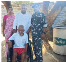
ఓటు వేసిన శతాధిక వృద్ధుడు