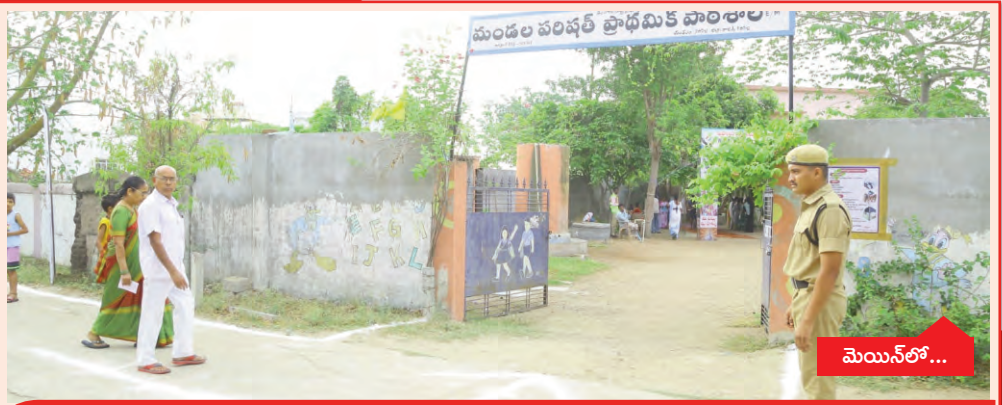
మెయిన్ లో... బ్యాలెట్ బాక్సుల్లో అభ్యర్థుల భవితవ్యం