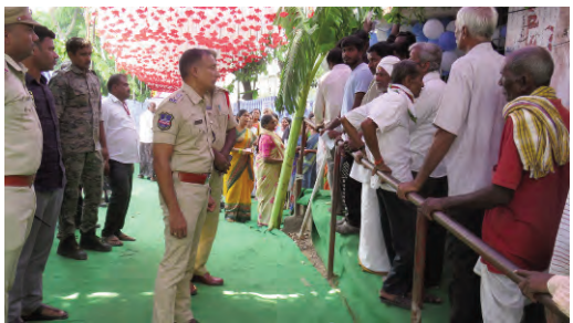
రెబ్బెన పోలింగ్ కేంద్రాలను పరిశీలించిన ఎస్పీ

అంతరాయం కలగకుండా అన్నిచర్యలు చేపట్టాలని పోలీస్ సిబ్బందికి సూచించారు. ఎన్నికల మార్గదర్శకులకు అనుగుణంగా ఎలాంటి పొరపాటలకు ఆస్కారం లేకుండా ఎన్నికల బందోబస్తు ప్రక్రియను విజయవంతంగా పూర్తి చేయాలన్నారు. ఎన్నికల నిర్వహణలో పోలీస్ అధికారులు, సిబ్బంది వనతీరు అభినందనీయం.. సమన్వయంతో పనిచేసే ఎన్నికలను విజయవంతంగా నిర్వహించడంలో కీలకముగా నిలిచిన పోలీస్ అధికారులు, సిబ్బంది పనితీరు అభినందనీయమని జిల్లా ఎస్పీ తెలిపారు. ఎన్నికలను విజయవంతంగా నిర్వహించడంలో శ్రమించిన పోలీస్ అధికారులు, సిబ్బందికి ప్రశంసించారు. ఈ సందర్భంగా ఎస్పీ మాట్లాడుతూ.. ఎలాంటి సంఘటనలు జరగకుండా పూర్తిగా ప్రశాంత వాతావరణంలో ఎన్నికలు విధుల నిర్వహణలో అధికారులు, సిబ్బంది శ్రమించిన తీరు స్ఫూర్తిదాయకంగా నిలిచింది. ఈ ఎన్నికల్లో పోలీసులు ఇతర ప్రభుత్వ శాఖలతో సమన్వయముగా పనిచేయడం ద్వారా ఎన్నికల నిర్వహణ మరింత సులభతరం అయిందని తెలిపారు.