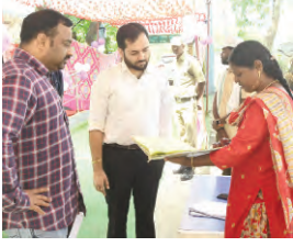
కలిసి సందర్శించి పోలింగ్ ప్రక్రియను పరిశీలించారు. ఈ సందర్భంగా అదనపు కలెక్టర్ మాట్లాడుతూ ప్రజలకు ఎలాంటి ఇబ్బంది ఉంటే సహాయం అందిస్తామని తెలిపారు.

జరిగిందని, సోమవారం ఉదయం 7 గంటల నుండి సాయంత్రం 4 గంటల వరకు జరిగిన లోక్ సభ ఎన్నికల పోలింగ్ కార్యక్రమంలో అర్హత గల ప్రతి ఒక్కరు తమ ఓటు హక్కును ఖచ్చితంగా వినియోగించుకునేందుకు వీలుగా పోలింగ్ కేంద్రాలలో త్రాగునీరు, నీడ, ఫ్యాన్లు, నిరంతర విద్యుత్ సరఫరా సౌకర్యాలు కల్పించడంతో పాటు గర్భిణీలు, వయోవృద్ధులు, దివ్యాంగుల కొరకు ప్రత్యేక వరుస ఏర్పాట్లు చేయడం జరిగిందని తెలిపారు.