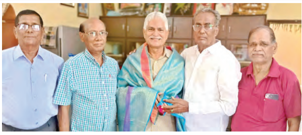
తెలంగాణ రాష్ట్ర ప్రభుత్వం ద్వారా నిర్వహించిన సామాజిక సేవల కార్యక్రమంలో ప్రజాపక్షం నాయకులు పాల్గొన్నారు.