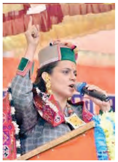
వివాదాస్పద వ్యాఖ్యలకు మారుపేరుగా నిలిచిన ప్రముఖ సభీ కంగనా రనౌత్ ఎన్ని విమర్శలు వెల్లువెత్తుతున్నప్పటికీ తన తీరు మాట్లాడకపోవడం లేదు. హిమాచల్ ప్రదేశ్ లోని మంది నియోజకవర్గం