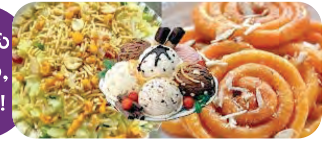
ఓటుకు పోహా, జిలేబీ!

ముందు వేల మంది పోహా, జిలేబీ రుచి చూశారు. మొదటిసారి ఓటు వేసిన యువతకు, నీనియర్ సిటిజన్లకు ఈ రెంటితో పాటు బనాకీమ్ ను కూడా ఈ సందర్భంగా పంచిపెట్టింది. ఓటు హక్కును సద్వినియోగం చేసుకునేలా ప్రోత్సహిస్తున్న ఈ ప్రోత్ ఫుడ్ సందర్భంగా ప్రశంసిస్తున్నారు. కార్పొరేట్ సంస్థలు కూడా చేయని గొప్ప పనికి ముందుకు రావడం ఆద్యుత్తును అంటున్నారు. కాగా, ఇండోర్ లోక్ సభ నియోజకవర్గంలో 25,26,803 మంది అర్హులైన ఓటర్లు ఉన్నారు. మధ్యప్రదేశ్ లోనే ఇది అతి