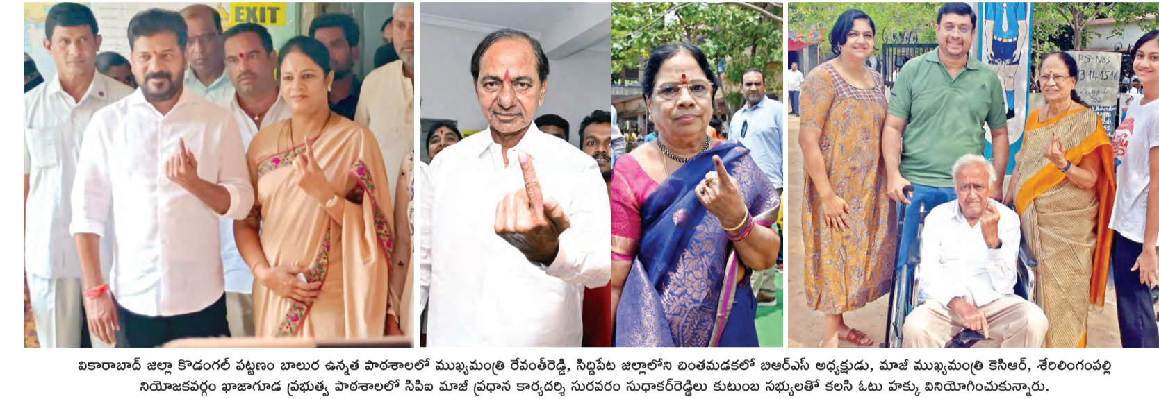
వికారాబాద్ జిల్లా కొండగల్ పట్టణం బాలరు ఉన్నత పాఠశాలలో ముఖ్యమంత్రి రేవంత్ రెడ్డి, సిద్దిపేట జిల్లాలోని బింతమడకల్ బిఆర్ఎస్ అధ్యక్షుడు, మాజీ ముఖ్యమంత్రి కేఆర్, శేరిలింగంపల్లి నియోజకవర్గం ఖాజూరాడ్ ప్రభుత్వ పాఠశాలలో సిపిఐ మాజీ ప్రధాన కార్యదర్శి సురవరం సుధాకర్ రెడ్డిలు కుటుంబ సభ్యులతో కలసి ఓటు హక్కు వినియోగించుకున్నారు.