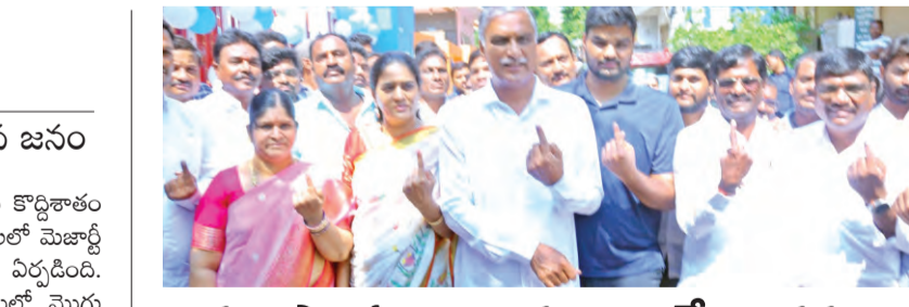
ప్రజాస్వామ్యం బలపడాలంటే అందరూ ఓటు వినియోగించుకోవాలి