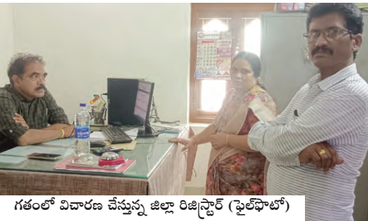
గతంలో విచారణ చేస్తున్న జిల్లా రిజిస్ట్రార్ (ఫైల్ ఫోటో)