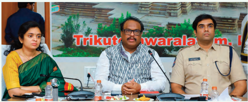
ఎన్నికలు, గ్రూప్-1లకు పటిష్ట ఏర్పాట్లు