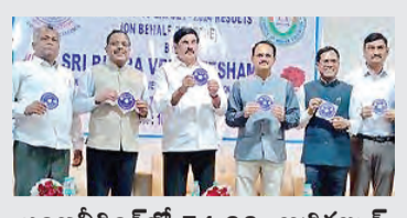
ఇంజనీరింగ్లో 74.98, అగ్రికల్చర్ ఫార్మసీలో 89.66 శాతం

ఆదివారం 19-05-2024 హైదరాబాద్ సంచిక: 26, సంచిక: 329 Published from: Hyderabad, Khammam, Karimnagar, Mahabubnagar పేజీలు: 12 ఖమ్మం: 8+8 కరీంనగర్: 8+8 మహబూబ్ నగర్: 12 వెల రూ. 5.00