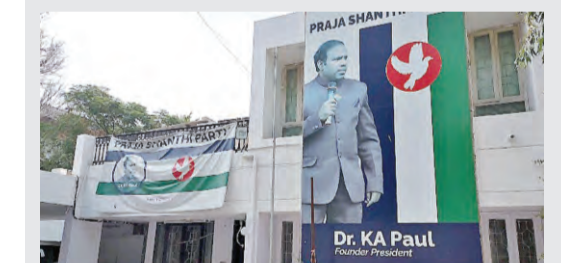
ప్రజాశాంతి పార్టీ ఎమ్మెల్యే టికెట్ల మోసం రూ.కోట్లలో