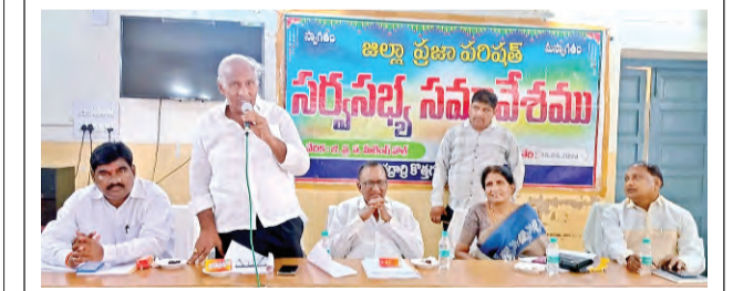
కలిసి పనిచేద్దాం... సమస్యలు పరిష్కరించుకుందాం

చేయాలని, అధికారులకు ఇప్పటికే ముఖ్యమంత్రి రేవంత్ రెడ్డి స్పష్టమైన ఆదేశాలు జారీచేశారు. ఇదే క్రమంలో వ్యవసాయ శాఖ మంత్రి తుమ్మల నాగేశ్వరరావు, పౌర సరఫరాల శాఖ మంత్రి ఎన్.ఉత్తమ్ కుమారెడ్డిలతో పాటు జిల్లాల ఇంఛార్జి మంత్రులు ధాన్యం కొనుగోలుపై సంబంధించి ప్రత్యేక దృష్టి సారించారు. మరోవైపు ప్రభుత్వ ప్రధాన కార్యదర్శి రోజువారీగా జిల్లా కలెక్టర్లతో పాటు సంబంధిత శాఖల అధికారులతో ఎప్పటికప్పుడు సమావేశం అవుతూ తాజా పరిస్థితులను తెలుసుకుని మిగిలిన ధాన్యం కొనుగోలు వేగవంతం చేసేందుకు చర్యలు చేపట్టారు. దీంతో సాంకేతిక ఎన్నికల ముగిసిన వెంటనే ధాన్యం కొనుగోలు చర్యలు ఉపయోగపడేవి కాకుండా మరోవైపు అకాల వర్షాల కారణంగా నష్టపోయిన పంటల తరువాయి 2లో