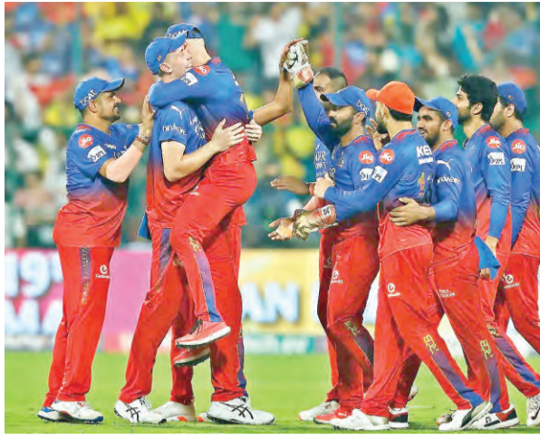
(61), రహ్మానె (33), జడేజా (42*), ధోనీ (25) రాణించారు. బెంగళూరు బౌల్లర్లలో దయాల్ 2, మాక్వేలర్ 1, షర్మిష్టా 1 వికెట్ తీశారు.

బెంగళూరు: విజయ్ లో బెంగళూరు ఫ్లేట్స్ కు దూసుకెళ్లగా, చెన్నై బోర్ని సుంచి నివసించింది. కీలక పోరులో బెంగళూరు 27 పరుగుల తేడాతో విజయం సాధించింది. తొలుత బ్యాటింగ్ చేసిన బెంగళూరు నిర్ణీత 20 ఓవర్లలో 5 వికెట్ల సహాయంతో 218 పరుగులు చేసింది. దుష్టెసిన్ (54), కోల్హా (47), పటీదార్ (41), గ్రేన్ (38) చెలరేగారు. చెన్నై బౌల్లర్లలో శార్దూల్ ఠాకూర్ 2, దేబ్బోసాని 1, శాంట్టర్ 1 వికెట్ తీశారు. అనంతరం బ్యాటింగ్ చేసిన చెన్నై 20 ఓవర్లలో 7 వికెట్ల కోల్పోయి 191 పరుగులు చేసింది. రచిన రచించిన