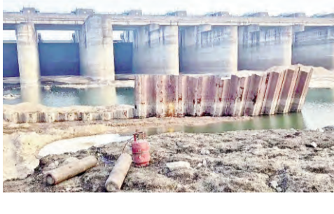
మేటలు, రాళ్లను తొలగించాలని నేషనల్ డ్యామ్ సేఫ్టీ అథారిటీ సూచించిన క్రమంలో పనులు ఆ మేరకు మొదలుపెట్టారు. డ్యామ్ సేఫ్టీ అథారిటీ సూచనల మేరకు వెంటనే పనులను చేపట్టాలని ఎల్ అండ్ టీ సంస్థకు ఇరిగేషన్ శాఖ అధికారులు జారీ చేసింది. ఈ క్రమంలో మేడిగడ్డ బ్లాక్ 7లోని 8 గేట్లను ఎత్తేందుకు పనులు ప్రారంభమయ్యాయి. వ్యవసాయ పరంగాను నీటి అవసరం ఉన్న నేపథ్యంలో తరువాయి 2లో

బ్లాక్-7లోని 8 గేట్లు ఎత్తేందుకు నేషనల్ డ్యామ్ సేఫ్టీ అథారిటీ సూచనల మేరకు పనులు ప్రారంభం ఇప్పటికే ఒక గేటును ఎత్తిపెట్టిన అధికారులు