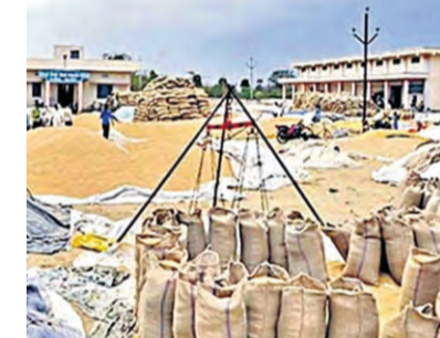
ఈ వర్షాల కారణంగా ధాన్యం తడిసి తీవ్ర ఆందోళనలో ఉన్న రైతులకు భరోసా కల్పించేందుకు మంత్రులు, ప్రభుత్వ యంత్రాంగం పూర్తిగా రంగంలోకి దిగింది. యాసంగిలో ఉత్పత్తి అయిన కొనుగోలు చేసేలా ప్రభుత్వం చర్యలు చేపట్టింది.

రంగంలోకి దిగిన మంత్రులు, అధికార యంత్రాంగం మే చివరినాటికి కొనుగోలు పూర్తి చేయడమే లక్ష్యం యాసంగిలో పండిన ప్రతి ధాన్యం గింజనూ కొంటామని రైతులకు ప్రభుత్వం భరోసా ప్రజాపక్షం / హైదరాబాద్