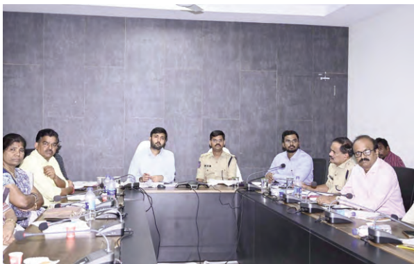
టీఎస్ బదులు టీజీ గా మార్పు చేస్తూ రాష్ట్ర ప్రభుత్వం ఇచ్చిన ఉత్తర్వులు పాటించాలి

ప్రజాపక్షం/మహబూబాబాద్/జయశంకర్ భూపాలపల్లి ప్రతినిధి : రాష్ట్ర ప్రభుత్వ ఉత్తర్వులు ననుసరించి టీఎస్ కి బదులుగా టీజీ అని మార్కాలని ప్రభుత్వ శాఖల అధికారులు, పిఎస్ యు, ప్రభుత్వ రంగ సంస్థలు, ఏజెన్సీలు పేర్లులో టీఎస్ బదులుగా టీజీగా మార్కాలని జిల్లాల కలెక్టర్లు ఆదేశించారు. ఇప్పటి వరకు తెలంగాణ రాష్ట్ర అభియోషన్ గా సూచించే టీఎస్ స్థానంలో టీజీని వినియోగించేందుకు కేంద్రం అనుమతిస్తూ గెజిట్ జారీ చేసినట్లు తెలిపారు. మార్చి నెలలో వాహనాల రిజిస్ట్రేషన్కు సంబంధించిన అనుమతులు రాగా, తాజాగా అన్ని ప్రభుత్వ వ్యవహారాల్లో టీఎస్ కు బదులుగా టీజీని వినియోగించేందుకు అనుమతి జారీ చేసినట్లు తెలిపారు. రాష్ట్ర ప్రభుత్వ ఉత్తర్వుల మేరకు జిల్లాలోని అన్ని ప్రభుత్వ సంస్థలు, పిఎస్ యులు, ఏజెన్సీల పెర్షనల్ ముందు టీఎస్ కు బదులు టీజీ గా మార్కాలని ఆదేశించారు. ఉదాహరణకు టీఎస్ఎస్పి డిసిఎల్ పేరును ఇక నుండి టీజీఎస్పి డిసిఎల్ గాను, టీఎస్ఆర్డీసీ పేరును టీజీఆర్డీసీగా మార్కాలని అన్ని ప్రభుత్వ శాఖల అధికారులకు శనివారం సర్క్యులర్ జారీ చేసినట్లు ఆయన పేర్కొన్నారు. జిల్లాలోని పబ్లిక్ సెక్టార్ యూనిట్లు, ఏజెన్సీలు, స్వయంప్రతిపత్తి గల సంస్థలు, ప్రభుత్వ సంస్థలన్నీ ఇకపై వాటి పేర్లను