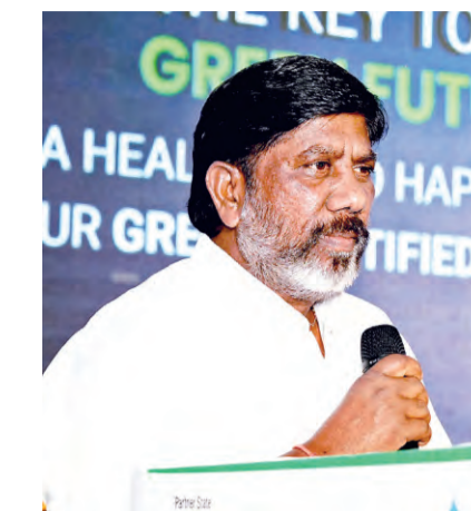
నిర్మాణం జరగడం, 2.50 లక్షల రెసిడెన్షియల్ యూనిట్లను గ్రీన్ హౌస్ మార్కులతో అదే సందర్భంలో జరిపిన గ్రీన్

ముంగిల్ల సమావేశంలో ఆయన ముఖ్యఅతిథిగా పాల్గొన్నారు. ఈ సందర్భంగా భట్టివిక్రమార్క ప్రసంగిస్తూ ఆకుపచ్చ జీవనం మనకు ఓ విధానంగా మారాలి, పచ్చని వారసత్వాన్ని మన తర్వాత తరాలకు అందించాలన్నా. 50 శాతం సీరు, 40 శాతం విద్యుత్తు అదా చేసే రీతిలో నిర్మించే గ్రీన్ బిల్డింగ్స్కు తెలంగాణ రాష్ట్ర ప్రభుత్వం సువి ప్రోత్సాహకాలు, సంపూర్ణ సహకారం ఉంటుందన్నారు. సగటు మానవుడు కొనుగోలు చేసే విధంగా గ్రీన్ బిల్డింగ్స్ నిర్మాణాలు ఉండాలని డిప్యూటీ సీఎం బిల్లరూసు కోరారు. హైదరాబాద్ ప్రపంచవ్యాప్తంగా ఉన్న పెట్టుబడిదారులకు స్వర్ణధామం అన్నారు. ఇక్కడి వాతావరణం, నీటి వసతి, నిరంతర విద్యుత్ సరఫరా, కావలసినంత భూమి, శాంతి భద్రతలు, ఫ్రెండ్లీ గవర్నమెంట్ అన్ని అందుబాటులో ఉన్నాయన్నారు. రీజినల్ రింగ్ రోడ్డు నిర్మాణం పూర్తయితే తెలంగాణ రాష్ట్రం పట్టణ రాష్ట్రం రూపుదిద్దుకుంటుందన్నారు. రాష్ట్ర 1.46బిలియన్ చదరపు అడుగుల మేరకు