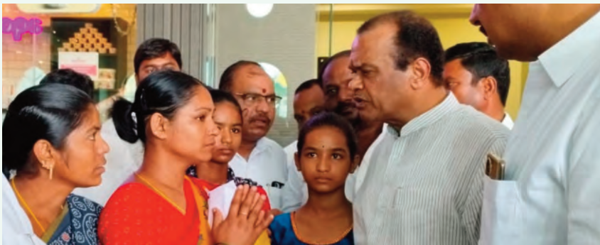
నేనున్నాను.. మీ పిల్లలందరి చదివిస్తా..