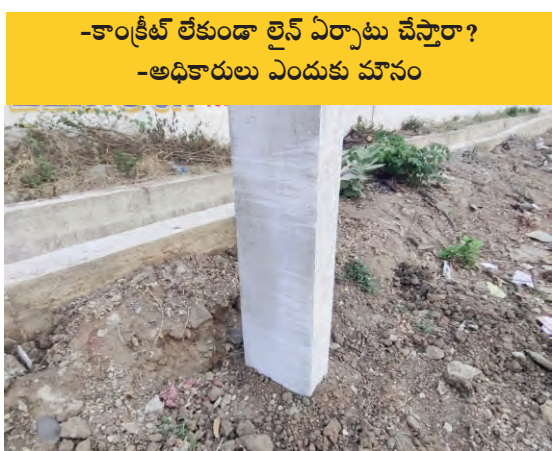
-కాంట్రీట్ లేకుండా లైన్ ఏర్పాటు చేస్తారా? -అధికారులు ఎందుకు మౌనం

ప్రజాపక్షం/వైరా: వైరా మున్సిపాలిటీ పరిధిలో రింగు రోడ్డు నుండి రోడ్డు అభివృద్ధి పనుల కోసం రోడ్డు వెడల్పులో భాగంగా రోడ్ల ప్రక్కన వేసిన స్తంభాల్లో అధికారులు కాంట్రాక్టర్ నిర్లక్ష్యం పట్ల ఎందుకు చర్యలు తీసుకోవడం లేదు. స్తంభాలు వేసిన వాటిపై ఎందుకు నిబంధనలకు విరుద్ధంగా వేశారు అని ప్రశ్నించకుండా కాంట్రీట్ లేకుండా వేసిన స్తంభాలపై అధికారులు ఎందుకు మౌనంగా ఉన్నారు. ఆ స్తంభాలు తీసి మరల భూమిలో కాంట్రీట్తో స్తంభాలు వేసే విధంగా చర్యలు చేపట్టడం లేదు. ఇప్పటికే రింగు రోడ్డు నుండి ఇందిరమ్మ కాలనీ వైపు వరకు ఏర్పాటు చేసిన విద్యుత్ లైన్ స్తంభాలు ఏర్పాటు పూర్తిగా ప్రజాధనం దుర్వినియోగం అవుతున్న అనే ఆరోపణలు వినిపిస్తున్నాయి. గత కొద్ది రోజులుగా కాంట్రాక్టర్ అధికారులకు తెలిసిన తెలియక వేసిన స్తంభాలపై మరోసారి దృష్టి సారించి కాంట్రీట్ లేకుండా వేసిన స్తంభాలు తీయించి మరల కాంట్రీట్ వేసి విధంగా చర్యలు చేపట్టాలని ప్రజలు కోరుతున్నారు.