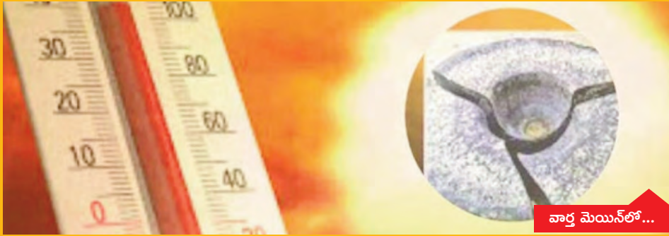
వార్త మెయిన్ లో...