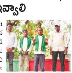
ప్రజాపక్షం/ఖిలావరంగల్: నగర పరిధిలోని చెరువు గట్ల వెంబడి మొక్కలు నాటడానికి ప్రణాళికలు సిద్ధం చేయాలి