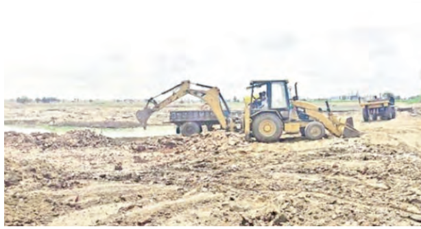
మట్టి తరలుస్తున్నది ఎక్కడికంటే ఇటుక బట్టి తయారీ కేంద్రాలవద్దకు, స్థిరస్థి వ్యాపారాలు ఏర్పాటు చేసుకున్న వెంచర్ లవద్దకు, గృహ నిర్మాణాలకోసం, రోడ్డు నిర్మాణాలకోసం, నిర్మించిన రోడ్లకు కుడి, ఎడమ వైపు పోయడం కోసం ఎలాంటి అనుమతులు లేకుండానే అక్రమార్కులు మట్టిని తరలింపు సొమ్ము చేసు

ప్రజాపక్షం/వర్తన్మపేట: వర్తన్మపేట నియోజకవర్గం లో ఐనవోలు, పర్వతగి, రాయపర్తి, వర్తన్మపేట మండలాల్లో మట్టి మాఫియా కోసం అక్రమార్కులు గాలింపు చర్యలు చేపట్టారు. ఎలక్షన్ కోడుతో సంబంధం లేకుండా గత పది హేను, ఇరవై రోజులనుండి ఏదేవుగా మట్టి మాఫియా జరుగుతుంది. రాయపర్తి, పర్వతగి మండలంలో మట్టి మాఫియా కాసుల వర్తం కురిసిస్తుంది. అక్రమార్కులు మండలంలో వున్న అధికారులకు, పేరున్న కొందరిని ఎంపికాని ఎవరి రేటు దగ్గట్టు వారికి చేతివటం ఆపగించిన తదుపరి దందాను ప్రారంభం చేసి నడిపిస్తున్నట్లు చెబుతున్నారు. పట్టభద్రుల ఎన్నికలు ఉన్నందున ఈ రెండు రోజులు ఆపి మట్టి సార్ట్ చేస్తూ దందా కొనసాగిస్తామని దందా నిర్వాహకులు బహిరంగంగా చెబుతున్నారు. వర్తన్మపేట, ఐనవోలు మండలాల్లోవున్నా చెరువులు, కుంటలు, ప్రైవేటు భూములు తిరుగుతూ మట్టి తరలింపు కోసం సొనదం చేస్తున్నారు. ముందుగా వారు అనుకున్న చేరువో, కుంటో, ఓ ప్రైవేట్ భూమి లో వున్నా మట్టి ఒకే బతే అ మండలంలో వున్నా అధికారులకు, అన్నిది కారులకు చేతి వాటం ఇస్తామని అభయం ఇచ్చి రంగా ప్రవేశం చేయడానికి సిద్ధ పడుతున్నారు.