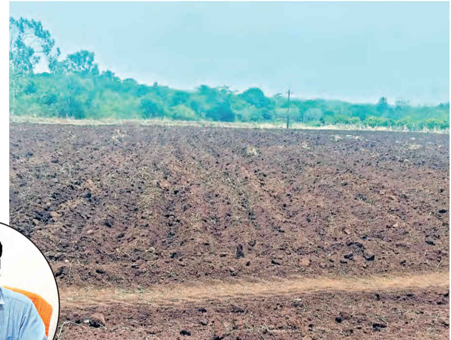
కాంపైజ్ 19,877, ఎంబీ 3,658, ఎస్ సీ 1,854 టన్నుల్లో వానాకాలం సగుకు అవసరం అని తెలుస్తుంది. మృత్ దీనులను, సూనె మొక్కజొన్న, మినుముల తదితర పంటలను చేయనున్నారు. పత్తి 2,63,500 విత్తనాలు క్వింటాల్లలో

ప్రజాపక్షం/వికారాబాద్ ప్రతినిధి : వికారాబాద్ జిల్లాలో వానాకాలం పంటలకు వ్యవసాయ శాఖ అన్ని ఏర్పాట్లు పూర్తి చేసింది. జిల్లాలో పంటల సాగుకు కావాల్సిన ఎరువులు, విత్తనాల నిల్వలను అందుబాటులో ఉండేలా చర్యలు తీసుకొన్నారు. జిల్లాలో 5097 లక్షల ఎకరాల్లో సాగుకు అవసరమైన ఎరువులు, విత్తనాలను కొరత రాకుండా వ్యవసాయ శాఖ అన్నిచర్యలు తీసుకుంది. వానాకాలం పంటల సాగు చేసేందుకు 75,437 మిల్లీలీటర్ల టన్నుల ఎరువులు అవసరమని వ్యవసాయ శాఖ అధికారులు ద్రవీకరించారు. అందుకు వికారాబాద్ జిల్లాలో ఉన్న ఎరువులు, విత్తన దుకాణాల్లో వానాకాలం సాగుకు సరిపడ ఎరువులు, విత్తన దుకాణాల్లో వానాకాలం సాగుకు సరిపడ ఎరువులను అందుబాటులో ఉండేందుకు ఏర్పాట్లు మొదలుపెట్టారు. ఇప్పటికే పలు దుకాణాలలో విత్తనాలు, ఎరువులు చేరుతున్నాయి. యురి గింజలసాగుకు దృష్టి / వికారాబాద్ జిల్లాలో 20 మంది లలో రైతులు వానాకాలం పంటల సాగుకు సిద్ధమవుతు