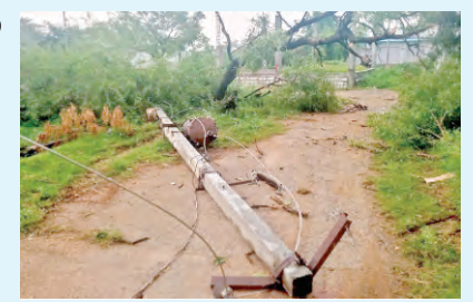
గ్రామ తడిసి పోయాయి. వారి కుటుంబాన్ని ప్రభుత్వం అదుకోవాలని గ్రామ ప్రజలు కోరుతున్నారు.