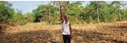
వర్షాకాలం సీజన్ కాబట్టి అధికారులు స్పందించి రైతులకు ఇబ్బందులు కలుగకుండా చర్యలు తీసుకోవాలని ఆప్రాంత రైతులు వేడుకుంటున్నారు. ఆడమరిస్తే అంతే సంగతులు పెను ప్రమాదం సంభవించకముందే అధికారులు స్పందించి చర్యలు తీసుకోవాల్సిన అవసరం ఎంతైనా ఉంది.

ప్రజాపక్షం/రామాయంపేట: విద్యుత్ అధికారుల నిర్లక్ష్యం మూలంగా రైతులు అరచేతిలో ప్రాణాలు పెట్టుకొని వ్యవసాయ పనులు చేయాల్సిన దుస్థితి నెలకొంది. చేతికంపే ఎత్తులో విద్యుత్ వైర్లు వేలాడుతున్నా అటువైపు ఆశాఖ అధికారులు కన్నెత్తి చూడడంలేదనే విమర్శలు నెలకొన్నాయి. ఎన్ని సార్లు పిర్యాదు చేసినా అధికారులు స్పందించడంలేదని రైతులు వాపోతున్నారు. రామాయంపేట పట్టణ శివారులోని బైపాస్ ప్రాంతంలో విద్యుత్ వైర్లు వేలాడుతున్నాయి. వచ్చేది