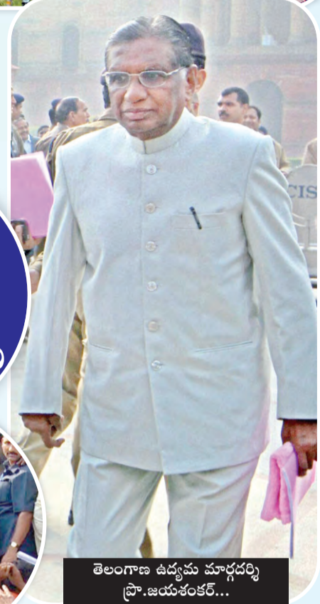
తెలంగాణ ఉద్యమ మూల్యదర్శి ప్రొ.జయశంకర్...