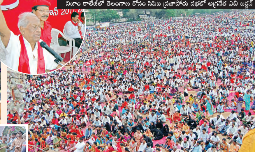
నిజాం కాలేజీలో తెలంగాణ కోసం సిపిఐ ప్రజాపోరు సభలో అగ్రనేత ఎ.బి. జర్నల్