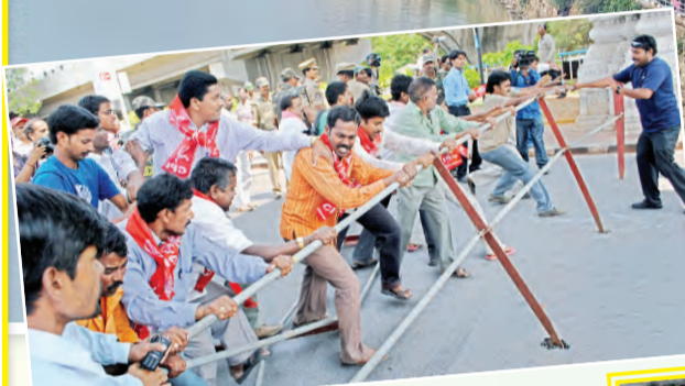
తెలంగాణ జెపిసి ఆవిర్భావం..