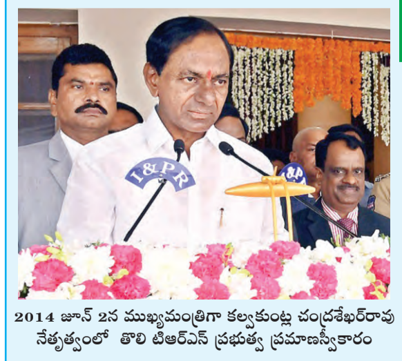
2014 జూన్ 2న ముఖ్యమంత్రిగా కల్వకుంట్ల చంద్రశేఖరరావు నేతృత్వంలో తొలి టిఆర్ఎస్ ప్రభుత్వ ప్రమాణస్వీకారం