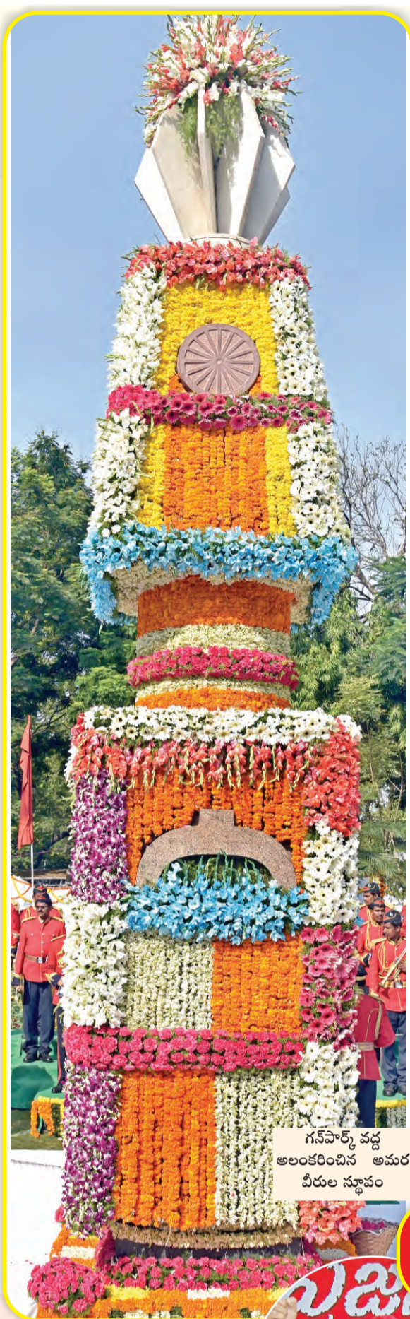
గవర్నర్ పట్ట అలంకరించిన అమర వీరుల స్థూపం