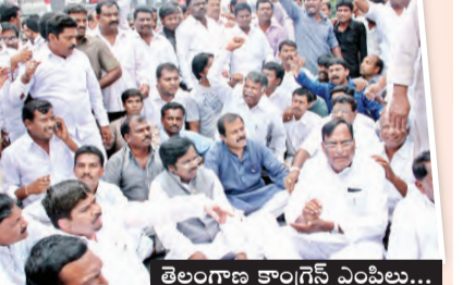
తెలంగాణ కాంగ్రెస్ ఎంపిలు...