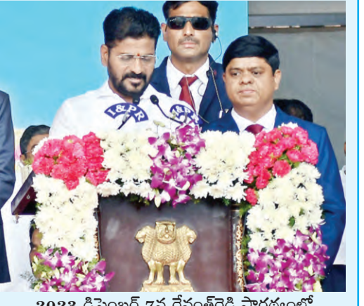
2023 డిసెంబర్ 7న రేవంత్ రెడ్డి సారథ్యంలో తొలి కాంగ్రెస్ ప్రభుత్వ పదవీస్వీకారం