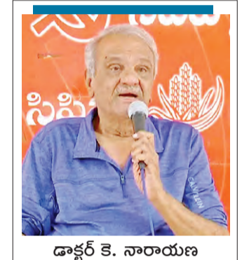
డాక్టర్ కె. నారాయణ సినిమా జాతీయ కార్యదర్శి

నా పేరు తిరుపతి అంది గిరిజన యువకు ... అది మా ఊరు పేరే అని ఆప్యాయంగా పలకరించా... ఇక చిందులే... నల్లలు అడవుల పరిశీలనకు వెళ్ళాం. అడవుల్లో కాలినడకన మారు మూల కేంద్రాల వద్ద కె.ఎం. 20 సంవత్సరాల యువతి అక్కడికి చేరుకున్నది. గిరి