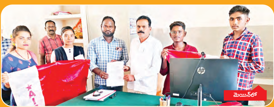
ప్రభుత్వ అనుమతి లేని కళాశాలల రద్దు