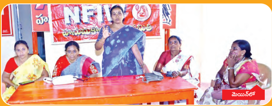
రాజకీయ, ఆర్థిక సాధికారతకు ఉద్యమిద్దాం