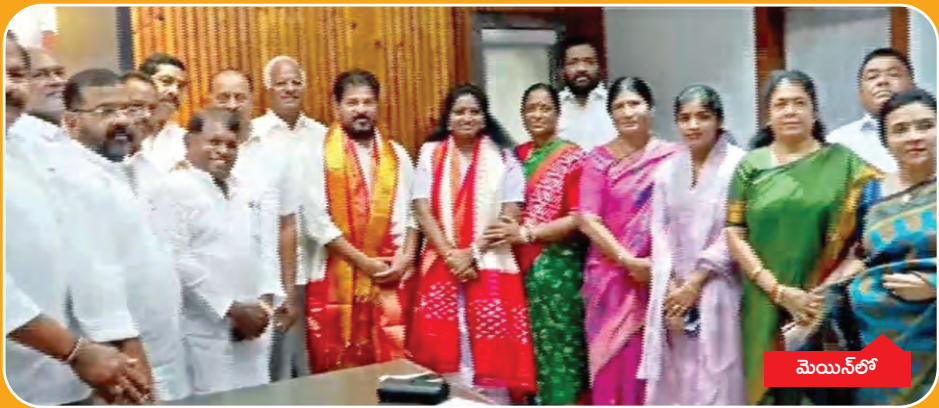
సిఎం రేవంత్ రెడ్డిని కలిసిన ఎంపి కడియం కావ్య